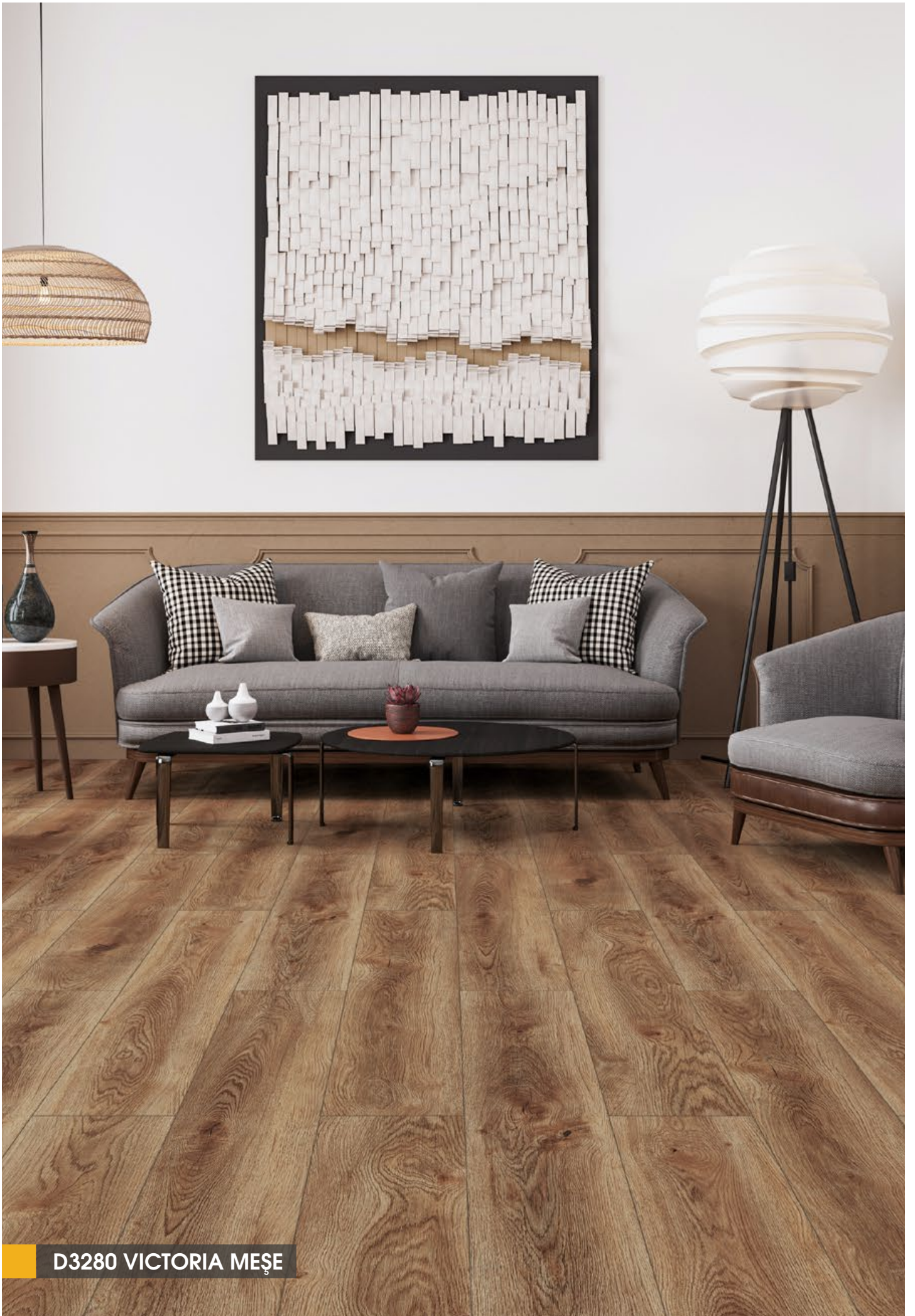
D3280 VICTORIA MEŞE