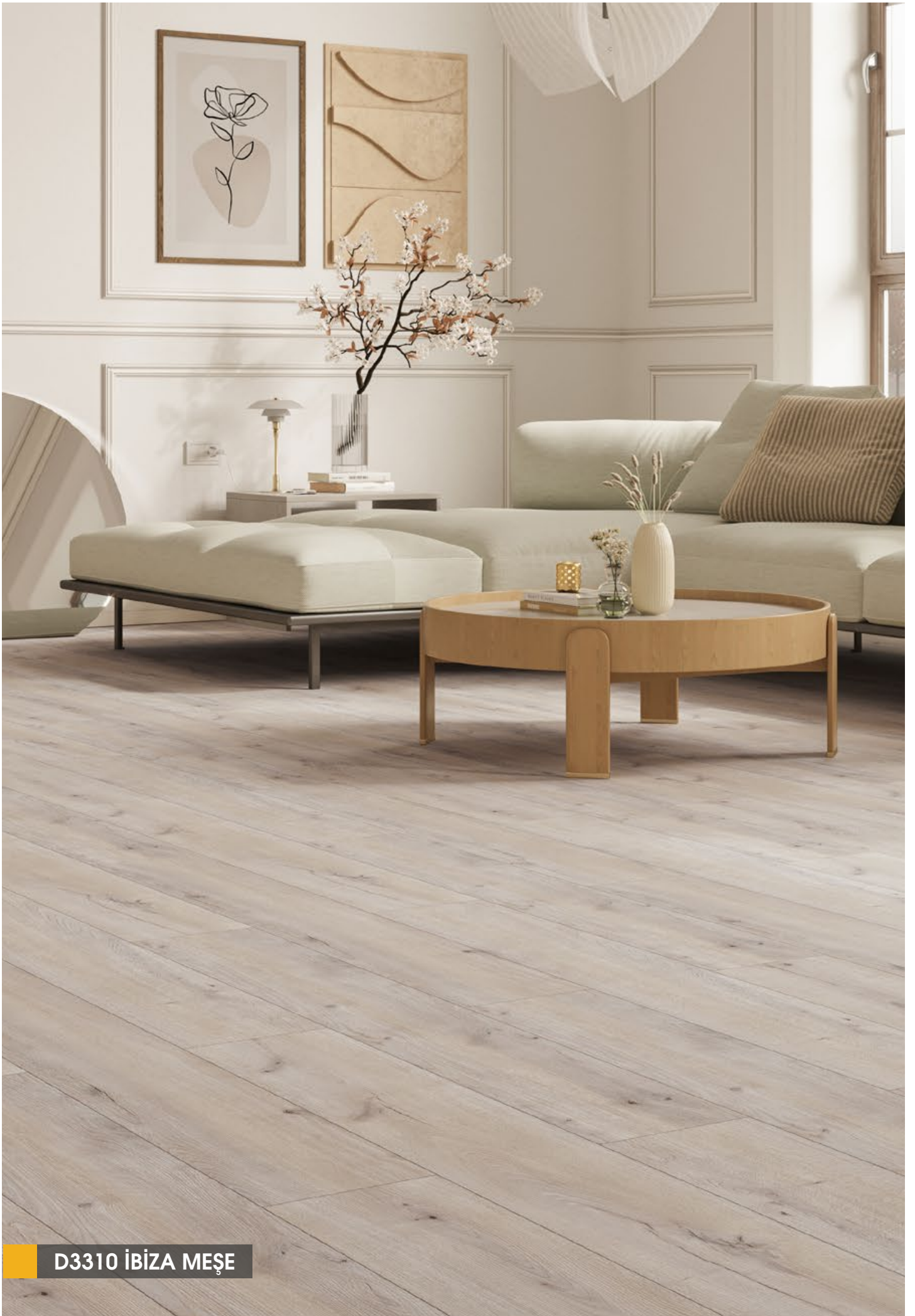
D3310 İBİZA MEŞE