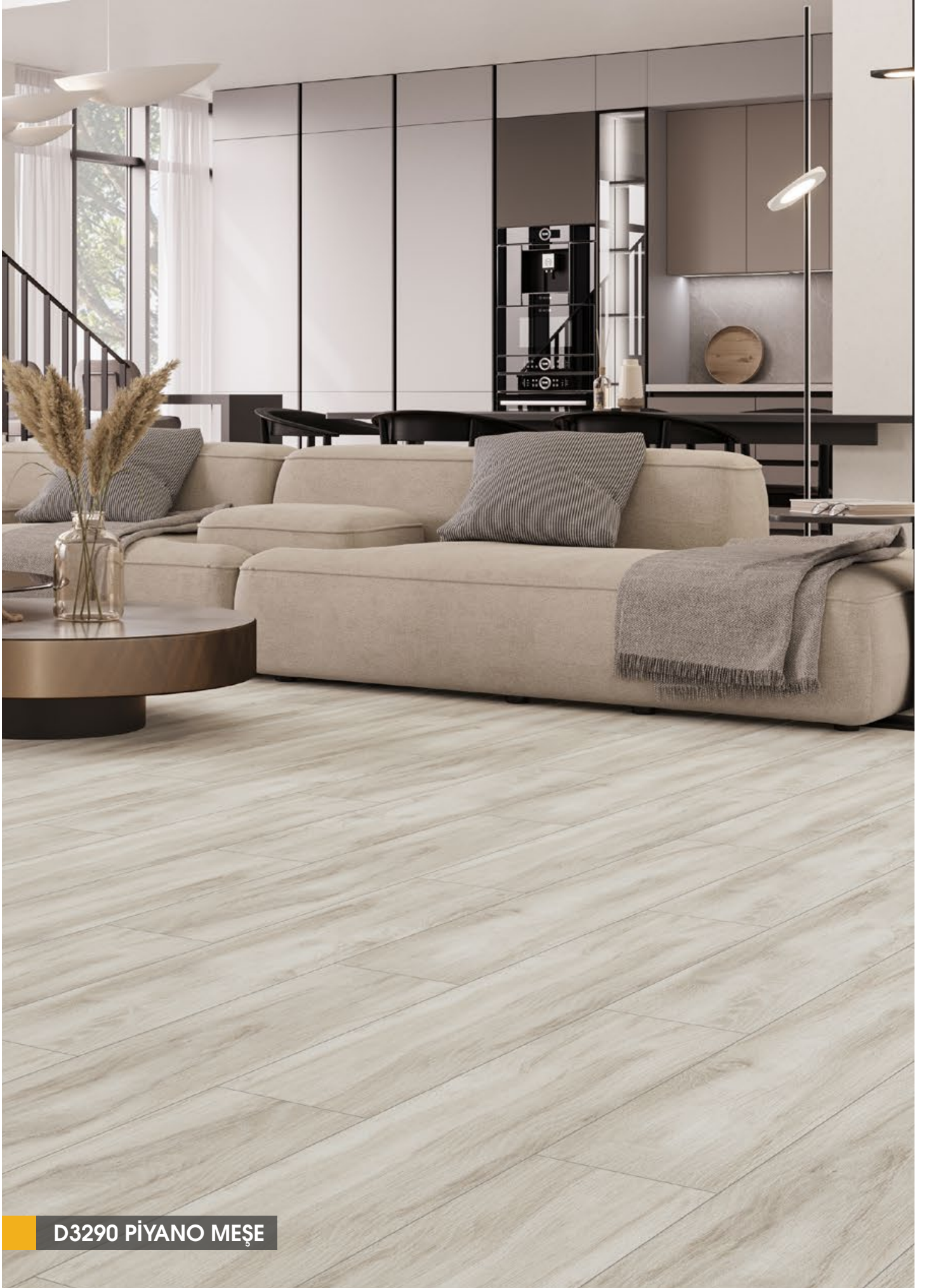
D3290 PİYANO MEŞE